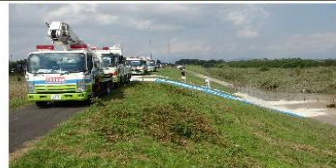
排水ポンプ車による排水作業(9月12日)